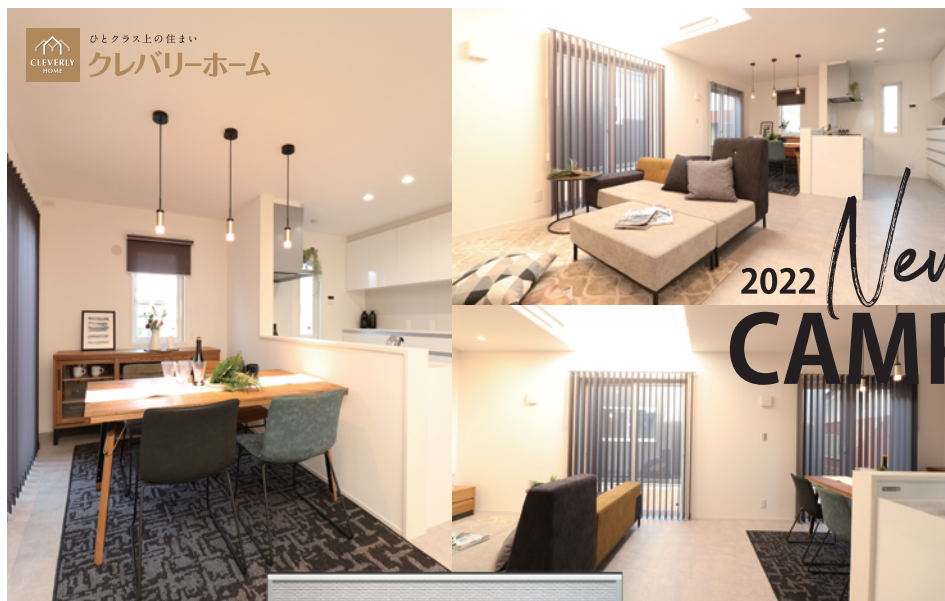
※室内写真は令和3年11月撮影