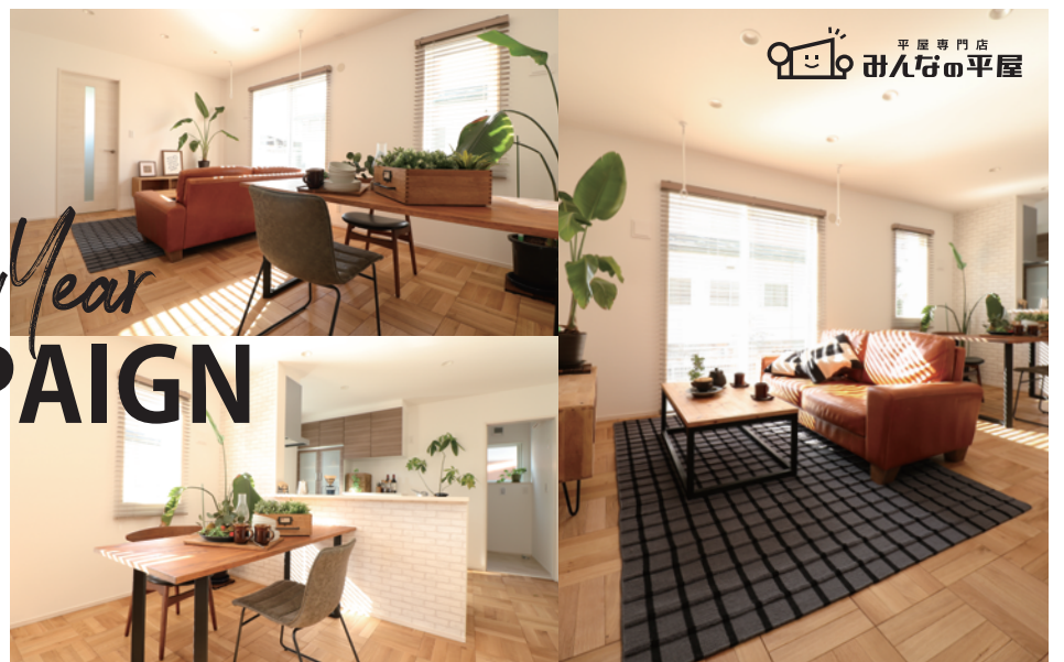
※室内写真は令和3年11月撮影